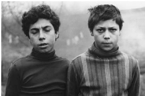
ZIGEUNER IN DUISBURG

Sinti und Roma werden seit jeher mit vielen diskriminierenden Vorurteilen betrachtet. Für die Themenretrospektive „Roms : Rencontres“, die Stefanie Bodien und Dario Marchiori im Rahmen der letzten Ausgabe des Brüsseler Festivals FILMER À TOUT PRIX (= Filmen um jeden/zu jedem Preis) im November 2013 zusammenstellten, haben sie Filme ausgewählt, die über diese Klischees hinausgehen und neue Anknüpfungspunkte bieten. Wir zeigen an zwei Abenden einen kleinen Ausschnitt der den gesamten europäischen Raum abdeckenden Retrospektive.