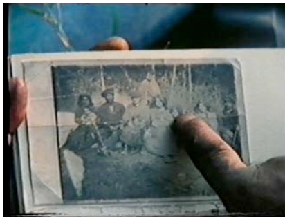
WIR SIND SINTIKINDER