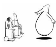
LES MAINS NUES