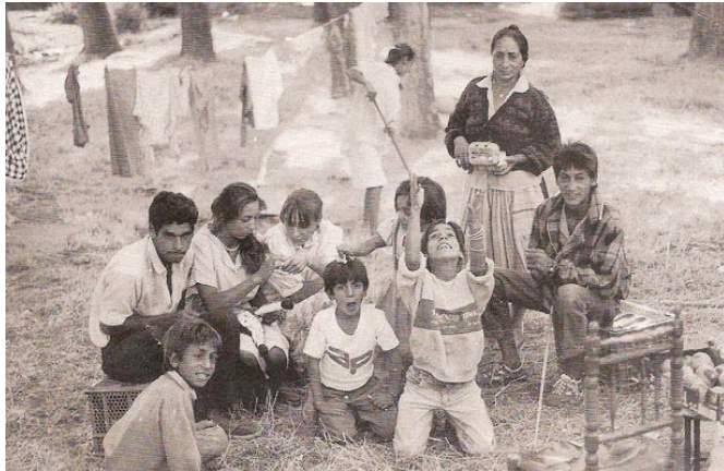
A LA ORILLA DEL RÍO

Dieses zweite Programm, „Gitanos“, besteht aus zwei um 1990 in Spanien gedrehten Filmen, die beide ohne Kommentar und Dialoge auskommen. Die Musik, die Stimmen und die Geräusche sind hier wesentliche Ausdrucksmittel.