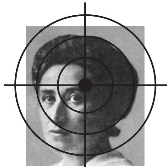
An der Waterloo Säule