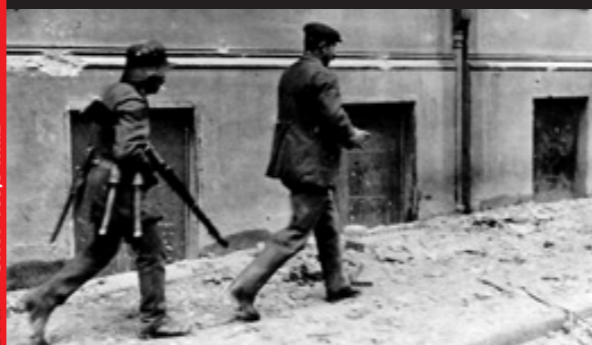
8. März 1919 in den Kämpfen um das Berliner Polizeipräsidium: Unmittelbar nach der Aufnahme dieses Bildes wurde dieser gefangene Arbeiter durch Regierungstruppen erschossen

Wiederholung: Dienstag, 2.12., 19–20 Uhr