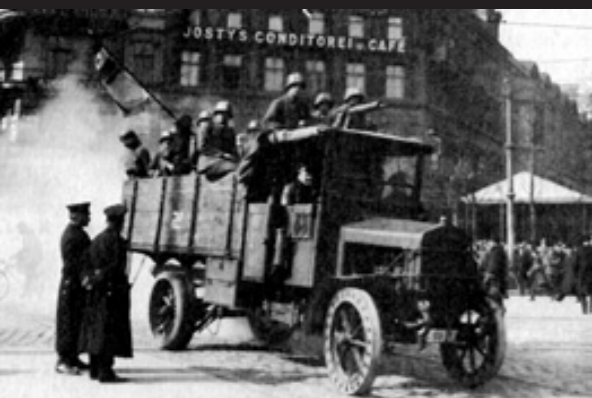
Kapp-Putsch am 13.3.1920: Rechtsradikales Militär rückt mit Hakenkreuzen an Stahlhelmen und Lastwagen in Berlin ein

Mit dieser Veranstaltungsreihe wollen wir an dieses bis heute tabuisierte Kapitel der deutschen Geschichte erinnern.