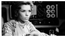
Eine Veranstaltung des Filmklubs Daria, der monatlich dazu einlädt, verlorene Klassiker, Geheimtipps und Lieblinge des Kinos gemeinsam wiederzuentdecken.

Der Film von Hermann Zschoche ist nicht nur der letzte, sondern auch das thematisch komplexeste und kontemplativste Science-Fiction-Werk, das von den DEFA-Studios verwirklicht wurde. Der mal poetische, mal heitere Film wendet sich, gegen allen realsozialistischen Zukunftstaumel, den Menschen und ihren Bedürfnissen zu, ihren Wünschen und Träumen. In seinem Weltraumabenteuer diskutiert er Fragen von Liebe, Pflicht und dem Glauben an ein besseres Morgen.